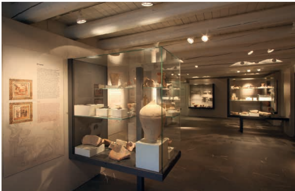
Il Museo Storico Archeologico: in alto una sala espositiva, a lato il Polittico di Jacobello da Bonomo (1386)

Il nuovo sito internet raccoglie tutte le iniziative, le informazioni, i progetti e i servizi degli istituti culturali della città – Museo Etnografico, Museo Storico Archeologico e Biblioteca Baldini – in una veste grafica rinnovata e adeguata anche ai nuovi dispositivi mobili. A Met, Musas e biblioteca sono dedicate tre differenti sezioni del sito: per i primi due si tratta più che altro di una rivi-