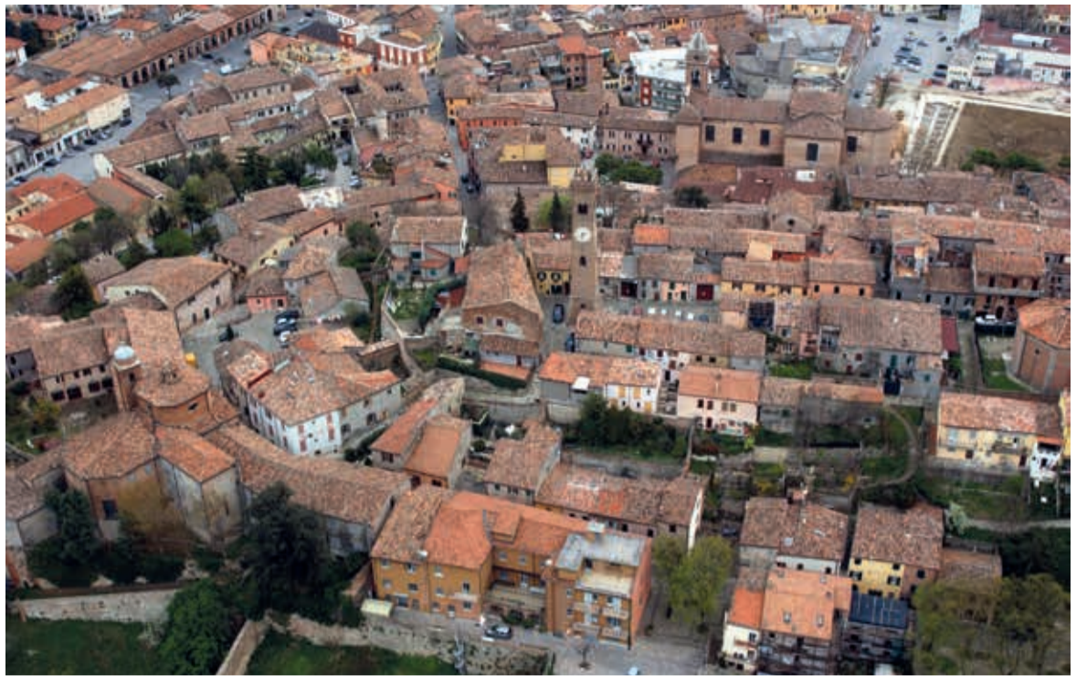
Una veduta aerea del centro storico

Queste caratteristiche dovranno essere indicate nella domanda di inserimento all'albo composta da una scheda tecnica a cui allegare autorizzazioni, materiale fotografico, planimetrie, documentazioni storiche, una relazione