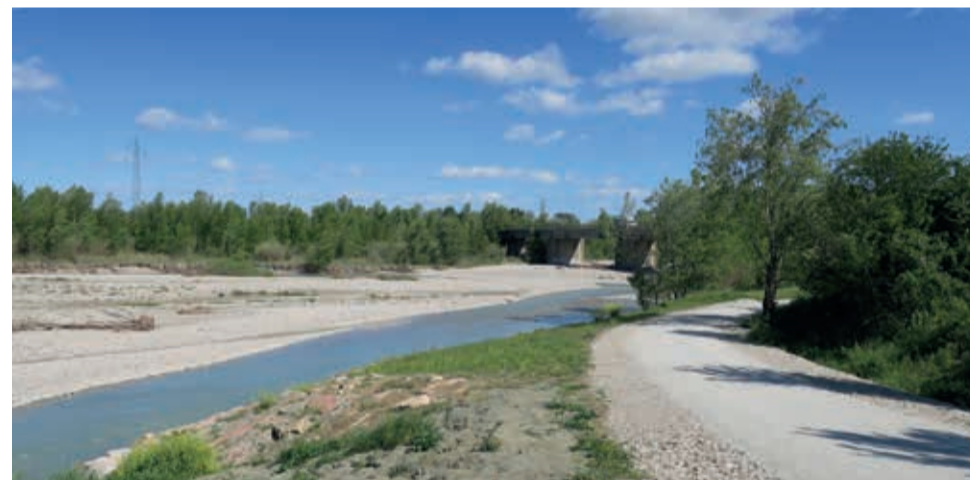
La ciclabile lungo il fiume Marecchia

Santarcangelo è entrato a far parte della rete dei Comuni ciclabili di Fiab (Federazione Italiana Ambiente e Bicicletta). La onlus che valuta la ciclabilità di una città e del suo territorio ha assegnato tre "bike-smile" su cinque al Comune di Santarcangelo.