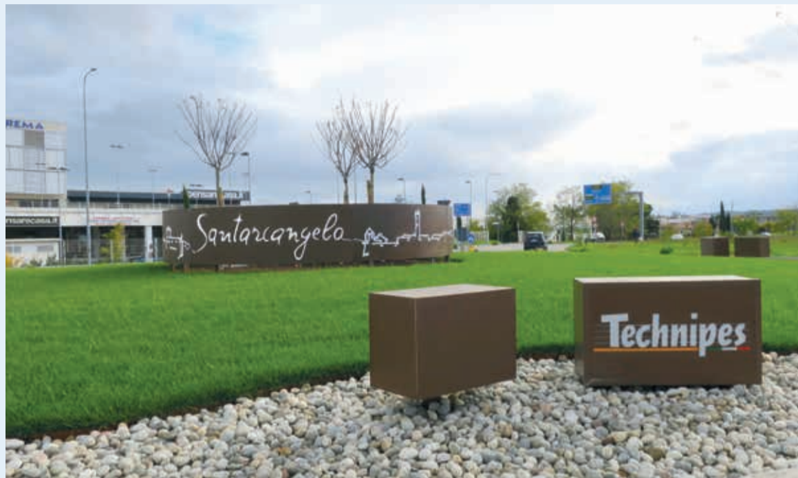
Il restyling della rotatoria completato nel mese di novembre

Quello della Technipes è uno dei tre progetti vincitori del bando per la ricerca di collaborazioni per la valoriz-